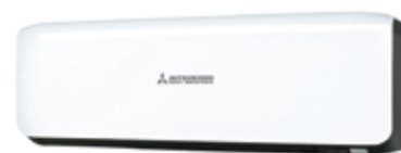
Black &amp; White (-WB)