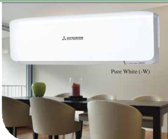
Pure White (-W)